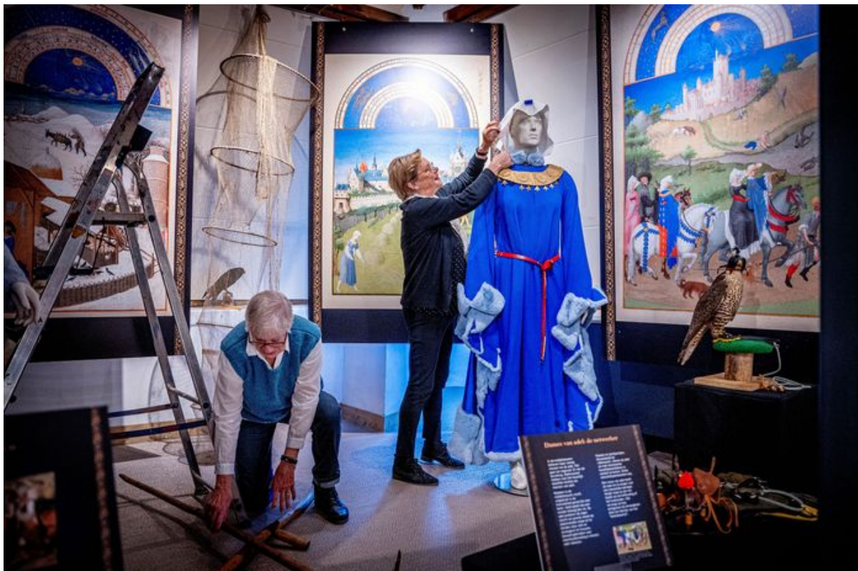
Opbouw van de tentoonstelling Wijvenwereld in Museum Kasteel Wijchen. Een mannequin wordt aangekleed in een van de kostuums uit het augustusblad.

De kleding wordt ingezet tijdens ons eigen Gebroeders van Lymborch festival, maar is ook zichtbaar geweest op andere plekken. Zo zijn vanaf 19 november 2022 een aantal kledingstukken te zien geweest tijdens de tentoonstelling Wijvenwereld in Museum Kasteel Wijchen.